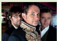
Pigor & Eichhorn